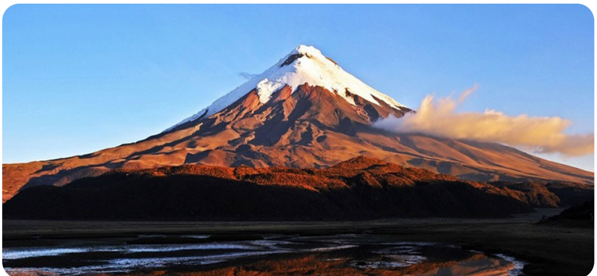
Volcán Cotopaxi, Quito

Desayuno en el hotel. Visitaremos el Parque Seminario o Parque de las Iguanas, donde estos simpáticos reptiles conviven entre jardines y esculturas. Luego recorreremos el Malecón 2000, moderno paseo junto al río Guayas, con sus